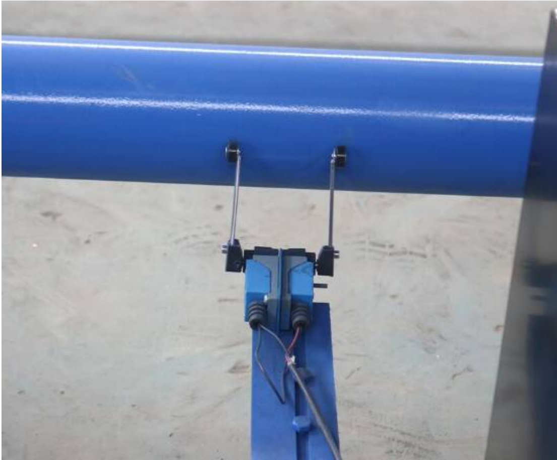
Interruptor de límite