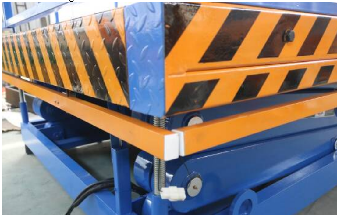
Seguridad de viaje bar