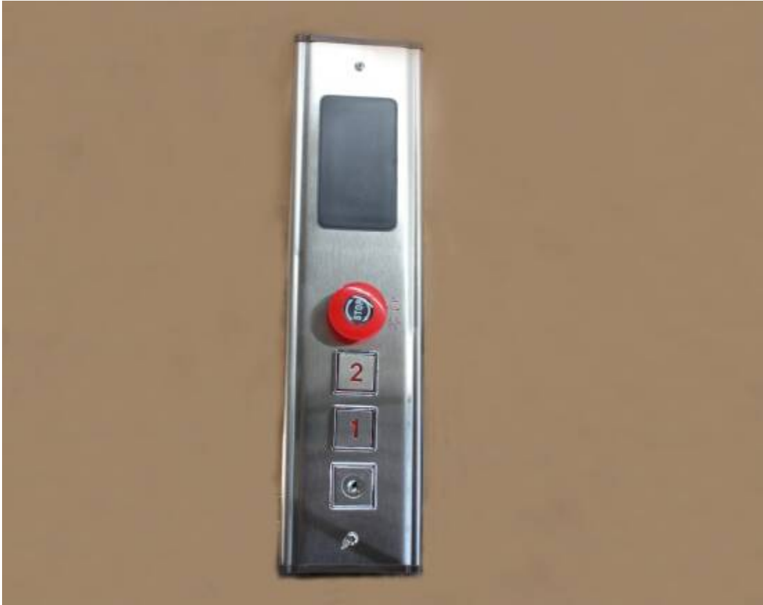
Panel de control Digital