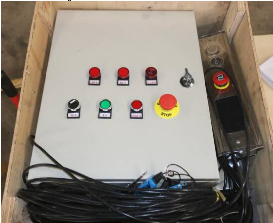
Caja de Control