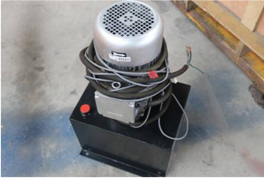
Estación de bomba