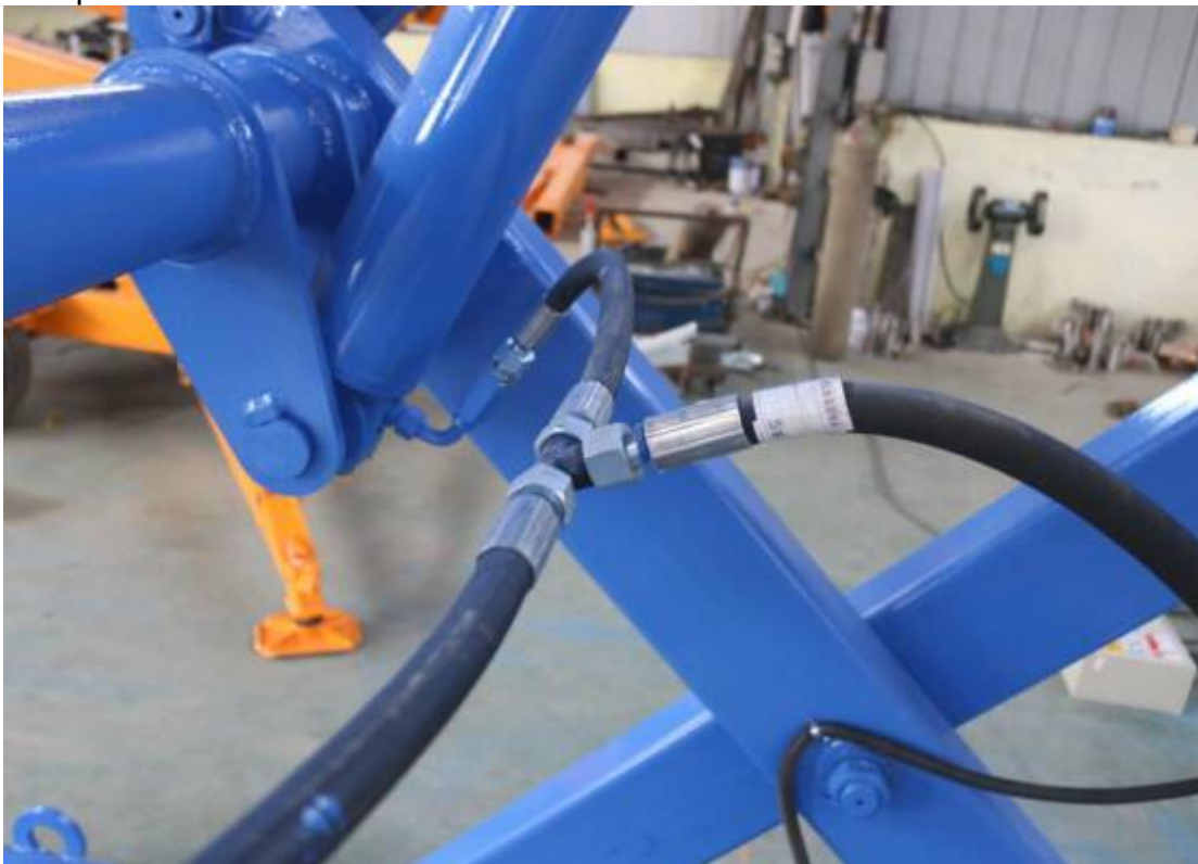
Aceite hidráulico de tubo